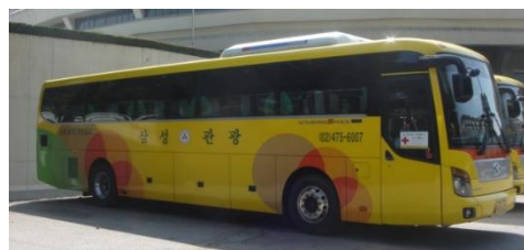
大型バス(イメージ)