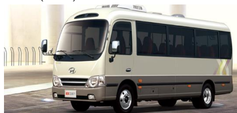
小型~中型バス(イメージ)